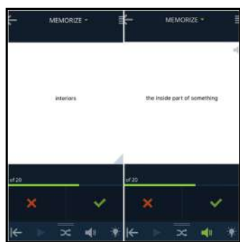
Рисунок 1 — Пример ФлК в веб-приложении Cram

В приложении StudyStack либо Cram в режиме matching обучающиеся должны подобрать подходящие слова к дефинициям.