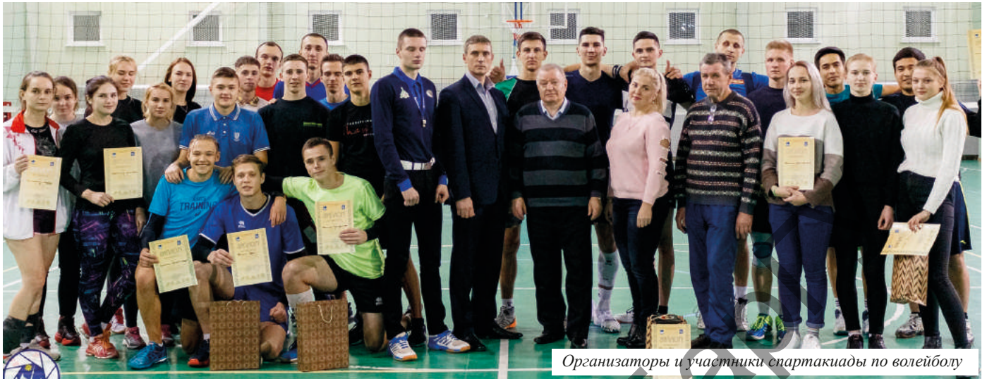
Организаторы и участники спартакиады по волейболу