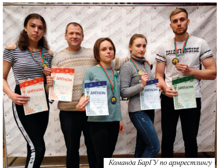
Команда БарГУ по армрестлингу