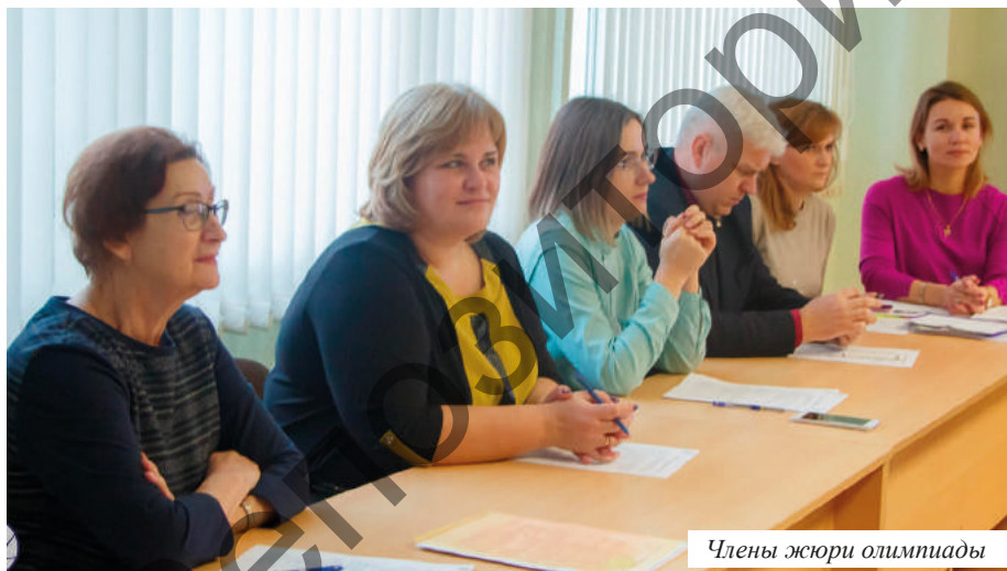
Члены жюри олимпиады