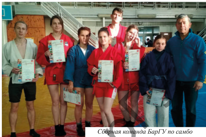
Сборная команда БарГУ по самбо