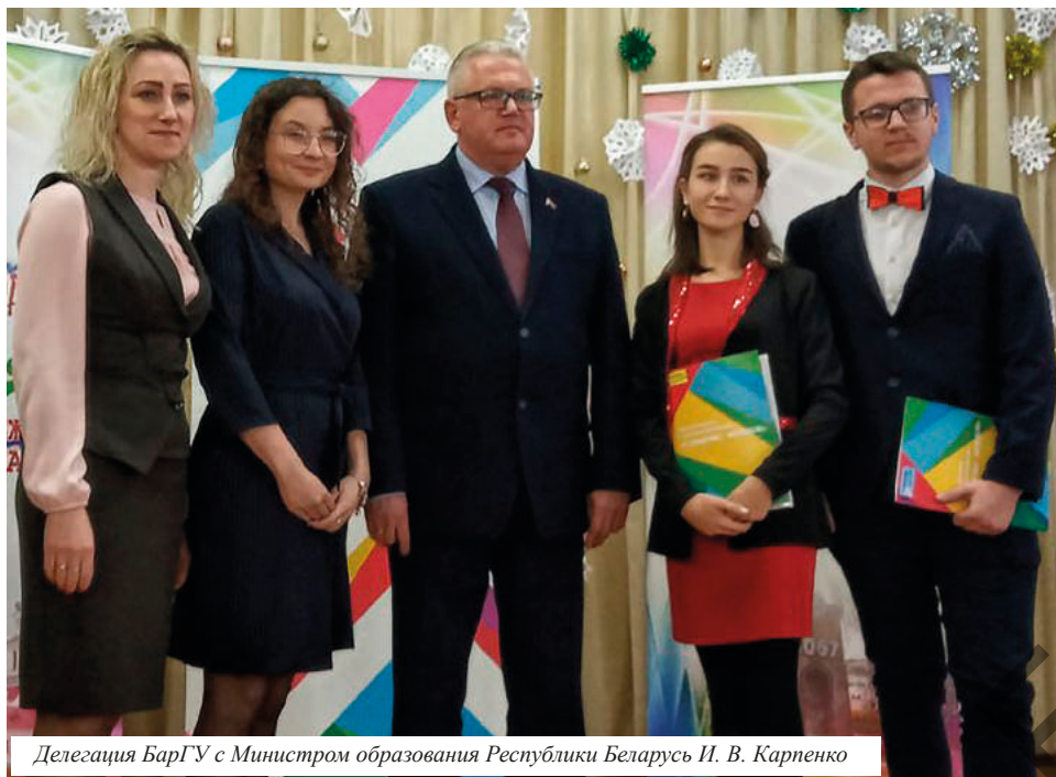
Делегация БарГУ с Министром образования Республики Беларусь И. В. Карпенко

12—13 декабря в молодёжной столице Беларуси-2019 в Орше проходил студенческий национальный форум «В объективе — МОЛОДЁЖЬ!». Из разных уголков страны в молодёжную столицу Беларуси-2019 съехались 170 участников форума, который проходил на базе учреждения образования «Оршанский государственный механико-экономический колледж».