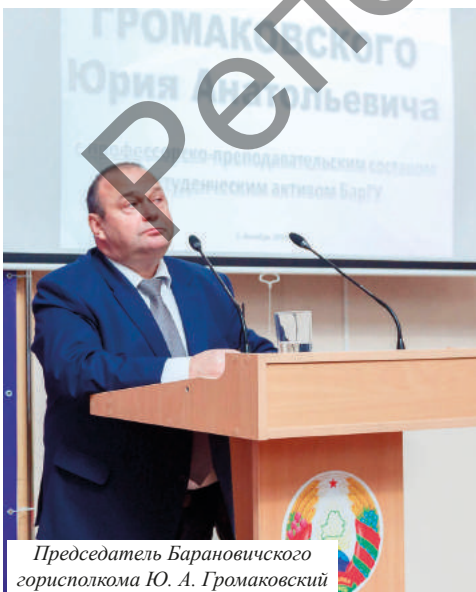
Председатель Барановичского горисполкома Ю. А. Громаковский