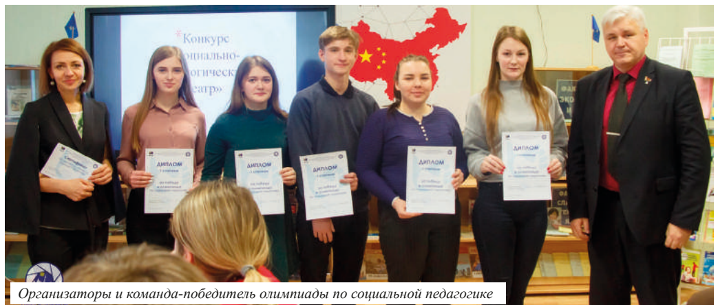
Организаторы и команда-победитель олимпиады по социальной педагогике

Задания в олимпиаде были разного уровня сложности: теоретический блок тестов, кроссвордов, фотоловушек, экспромт-высказывания цитат великих педагогов, инсценировка сказки с акцентом на воспитательный момент, алгоритм работы социального педагога с семьями, находящимися в социально опасном положении, с