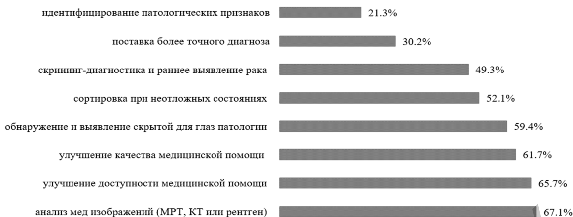
Рисунок 2 — Применение ИИ в медицинской сфере по мнению респондентов

Данные результаты можно объяснить тем, что разработка ИИ еще только на начальном пути развития и активного использования, но не стоит забывать, что ИИ — это алгоритмы, созданные человеком. В результате замены человека ИИ в различных сферах труда, в будущем может возникнуть социальная напряженность в обществе (76,1 %) и это может привести к конкуренции между человеком и ИИ (63 %). Согласно с важностью сегодняшних проблем внедрения ИИ в медицину, таких как проблема конфиденциальности (78 %), проблема правового статуса ИИ (66 %), проблема ответственности за решения, принимаемые ИИ, при постановке диагноза, лечения, терапии (87 %). Также возможна проблема социальной напряженности и возможных изменений в состоянии здоровья людей при воздействии ИИ (73 %). Большинство участников анкетирования уверены, что деятельность ИИ, должна регулироваться на законодательном уровне (52,2 %).