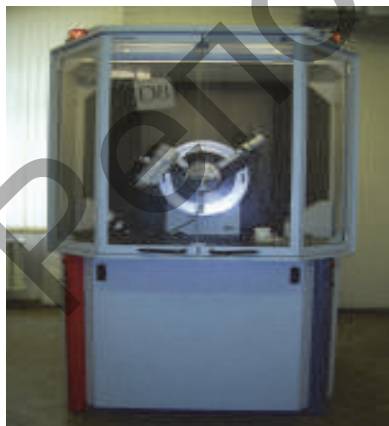
Рисунок 1 — Рентгеновский дифрактометр D8 Advance (“Bruker”, Германия)

Представим результаты фазового состава всех исследуемых композиций с наложением линий рентгенограмм образцов с наноконпонентами на базовые образцы (рисунок 2). Красная шкала показывает результаты образцов с наноконпонентами, а черная — исходных образцов.