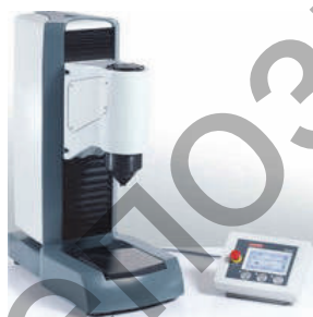
Рисунок 1 — Твердомер DuraJet

Для измерений использовали твердомер DuraJet (рисунок 1) фирмы Struers (Дания, 2013 год ввода в эксплуатацию). Данное оборудование оснащено автоматическим нагружением индентора, выдержкой и разгрузкой, автоматическим тестированием нагрузок, которые исключают отклонения в течение проведения измерений. Используемый твердомер представляет современную технологию и соответствует действующим нормам и стандартам. Испытания проводились по стандартной методике. Использовался метод Роквелла (шкала В, С). Представим результаты испытаний твердости исследуемых образцов покрытий (рисунок 2).