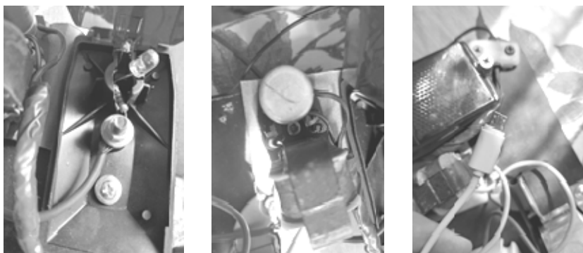
Рисунок 2 — Светодиодный индикатор, выпрямитель на основе диодного моста, кабель micro USB