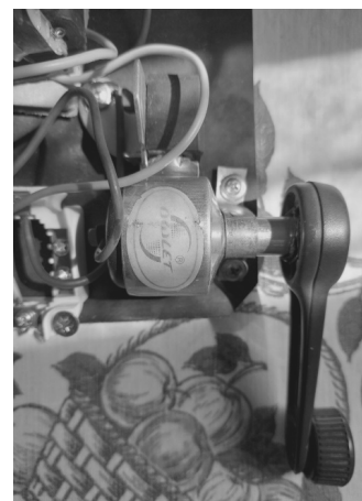
Рисунок 1 — Модифицированная динамомашинка

Система умного освещения лежачего полицейского представляет собой источник света, который активируется, если датчик света фиксирует недостаточную освещённость. Макет данной системы базируется на микроконтроллере Arduino Uno и использует светодиод (как источник света) и фоторезистор (как датчик света). Светодиод подключается к пину ~10 и через резистор к пину Gnd [2]. Фоторезистор в свою очередь подключается к пину 5V и через ещё один резистор к пинам A0 и GND. Схема сборки устройства на рисунке 4.