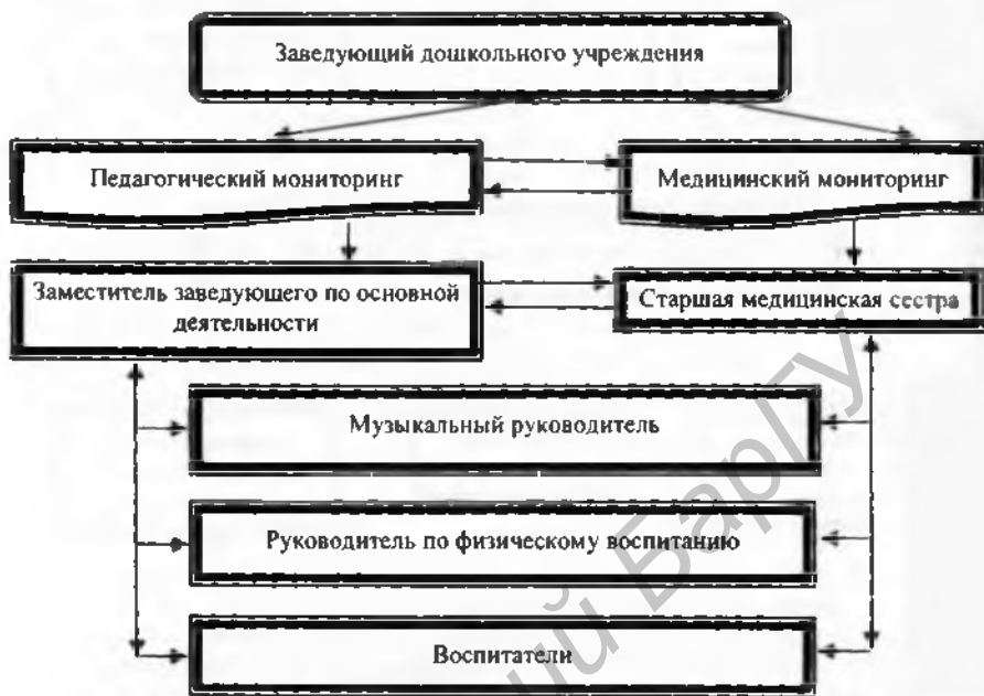
Рисунок 5 — Информационная структура ДУ «Молотковичский детский сад» Пинского района Брестской области