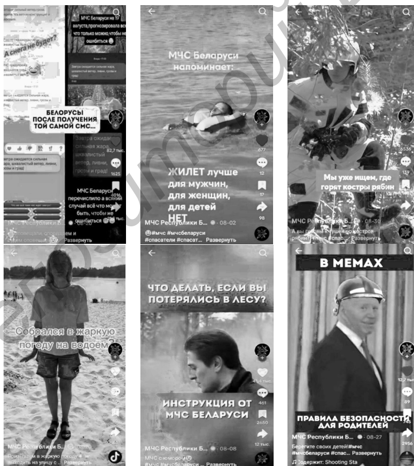
Рисунок 2 — Примеры публикаций на официальном аккаунте МЧС в TikTok [5]

Как можно заметить, люди положительно отзываются о социальных сетях данного министерства, что улучшает его репутацию, повышает узнаваемость и лояльность граждан к нему. Именно поэтому грамотное ведение социальных сетей можно считать прекрасной рекламой не только для коммерческих организаций.