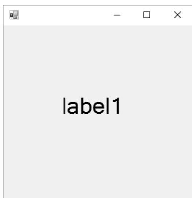
Рисунок 1 — Главное окно приложения