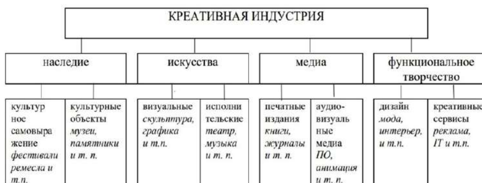
Рисунок 1 — Структура креативной индустрии

Основная часть. Креативная экономика — это сектор экономики, связанный с интеллектуальной деятельностью. Её главные ресурсы: идеи и технологии, которые придумывают люди. К креативным индустриям относят многие сферы жизни (рисунок 1).