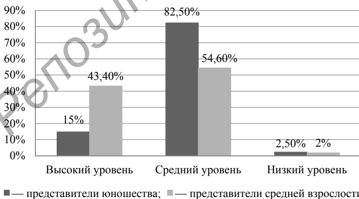
Рисунок 2 — Представленность мотивационного компонента гражданской идентичности у юношей и представителей средней взрослости

Результаты по той же шкале представителей средней взрослости расположились следующим образом: у большинства представителей средней взрослости диагностируется средний уровень выраженности «мотивационного компонента» 54,6 %. Высокий уровень выраженности мотивационного компонента составляет 43,4 %, низкий уровень — у 2 %.