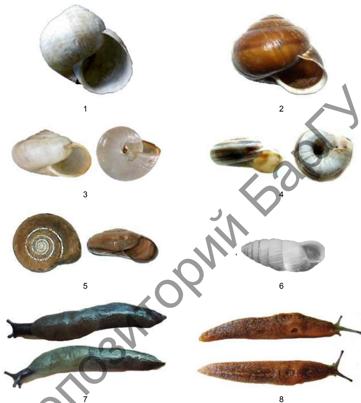
Рисунки 1—8. — Чужеродные виды моллюсков: 1 — Helix lutescens ; 2 — Arianta arbustorum ; 3 — Monacha cartusiana ; 4 — Xerolenta obvia ; 5 — Oxychilus alliarius ; 6 — Brephulopsis cylindrica ; 7 — Krynickillus melanocephalus ; 8 — Limacus flavus *