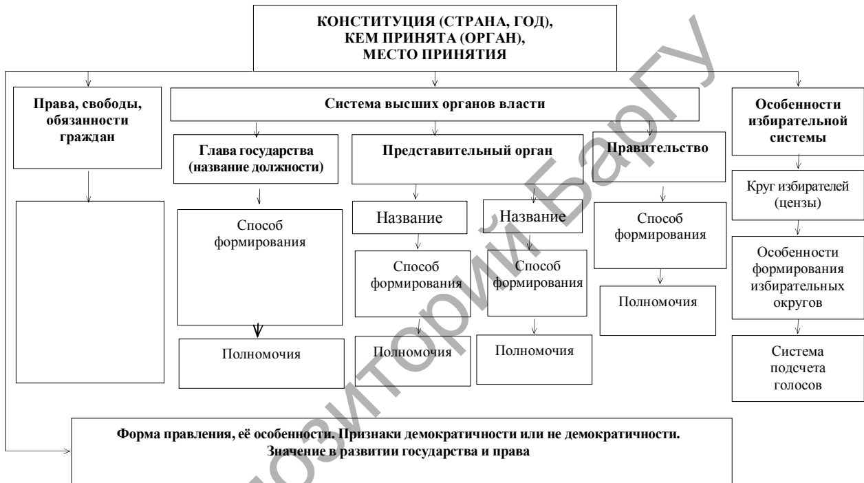
Рисунок 2 — Схема ответа