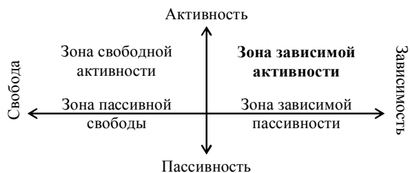
Рисунок 1 — Система координат определения влияния ИОС, ГОС и ПОС на вектор развития студентов экспериментальной группы (констатирующий этап исследования)

В системе координат на пересечении осей «активность—пассивность» и «свобода—зависимость» образуются четыре зоны, создающие условия для принятия ценностей, присутствующих в каждой из исследованных образовательных сред, но на различных уровнях (зоны перечислены по мере убывания их продуктивности): свободной активности — зона свободного, активного, мотивированного, творческого принятия ценностей; зависимой активности — зона внешне формального, но активного принятия ценностей; пассивной свободы — зона свободного, безмятежного принятия ценностей; зависимой пассивности — зона вынужденного, принудительного принятия ценностей. Результаты исследования влияния ИОС, ГОС и ПОС на вектор развития студентов экспериментальной группы по итогам констатирующего этапа исследования свидетельствуют, что все среды занимают нишу в зоне зависимой активности (рисунок 1). Она обеспечивает внешнее, формальное принятие студентами тех возможностей и условий, которыми располагают ИОС, ГОС и ПОС. При этом обучающиеся берут из них то, что в них заложено, но благодаря проявляемой активности они расширяют круг этих предложений. Студенты на уровне идеального представления рассматривают