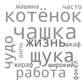
Рисунок 2 — Облако слов

Создание цепочек из гексов активизирует ребят, позволяет использовать индивидуальную, парную или групповую форму работы.