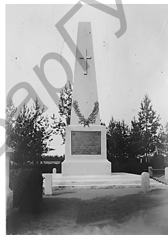
Малюнак 3 — Абеліск у Баранавічах у памяць аб медыцынскім персанале, што загінуў падчас эпідэміі у 1920—1923 гг. [14]

Заклучэнне. Падсумоўваючы ход супраць эпідэмічнай барацьбы 1919—1923 гг, варта адзначыць, што для Польшчы акупаваных беларускія землі сталі санітарным кардонам на шляху распаўсюджвання сыпнога тыфу і іншых хвароб. На прыкладзе працы баранавіцкага рэпатрыяцыйнага этапу бачна, што недасканалая арганізацыя супрацьэпідэмічных мерапрыемстваў з боку польскіх улад стала прычынай захавання значнага захворвання як сярод бежанцаў, так і санітарнага медперсаналу, які мусіў ахвяраваць сваім жыццём дзеля стрымлівання эпідэміі.