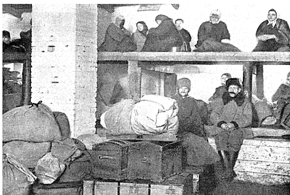
Малюнак 2 — Бежанцы ў бараку ў Баранавічах, 1922 г. [8, с. 10]

У выніку тэарэтычных падмуркі пабудовы польскага санітарнага кардону на практыцы рэалізаваліся недасканала, што выклікала негатыўныя наступствы і нават абумоўлівала рост захворвання. Антысанітарныя ўмовы пражывання бежанцаў пры знаходжанні ў каранціне, адсутнасць раздзелу хворых і здравых людзей і іх сумеснае знаходжанне выклікала заражэнне нават здравых бежанцаў тыфам. Так, паводле ўспамінаў Л. Галяка нават пасля тыднёвай дэзінфекцыі яго сям'я заразілася сыпным тыфам, што на думку аўтара адбылася менавіта падчас знаходжання на каранціннай станцыі ў Баранавічах [7, с. 30–31]. Карэспандэнт газеты «Świat» М. Фукс скончыў свой рэпартаж пра баранавіцкі рэпатрыяцыйны этап апісаннем высокай смяротнасці бежанцаў: «...трунаў не хапае, так што трупы складаюцца адзін на аднаго... Яны ўтвараюць бязладную, жудасную кучу... кроў рэжацца ў венах пры гэтым выглядзе... Яны ўсё роўна адправяцца ў агульную магілу, і ніхто са сваякоў больш не знойдзе таго месца» [8, с. 8, 11].