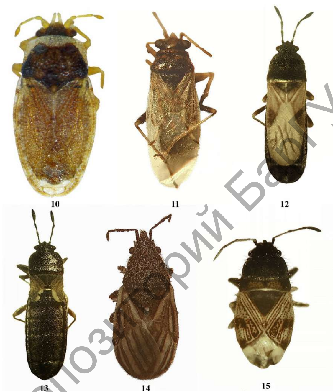
Рисунки 10—18. — Габитусы клопов с дорсальной стороны (II): 10 — Parapiesma silenes (Horváth, 1888); 11 — Nysius cymoides (Spinola, 1837); 12 — Dimorphopterus spinolae (Signoret, 1857), полнокрылая форма; 13 — Dimorphopterus spinolae , короткокрылая форма; 14 — Tropidophlebia costalis (Herrich-Schaffer, 1850); 15 — Pionosomus opacellus Horvath, 1895; 16 — Beosus maritimus (Scopoli, 1763); 17 — Ceraleptus gracilicornis (Herrich-Schaffer, 1835); 18 — Gonocerus juniperi Herrich-Schaffer, 1839

Figures 10—18. — Dorsal habituses of bugs (II): 10 — Parapiesma silenes (Horváth, 1888); 11 — Nysius cymoides (Spinola, 1837); 12 — Dimorphopterus spinolae (Signoret, 1857), macropterous form; 13 — Dimorphopterus spinolae , brachypterous form; 14 — Tropidophlebia costalis (Herrich-Schaffer, 1850); 15 — Pionosomus opacellus Horvath, 1895; 16 — Beosus maritimus (Scopoli, 1763); 17 — Ceraleptus gracilicornis (Herrich-Schaffer, 1835); 18 — Gonocerus juniperi Herrich-Schaffer, 1839