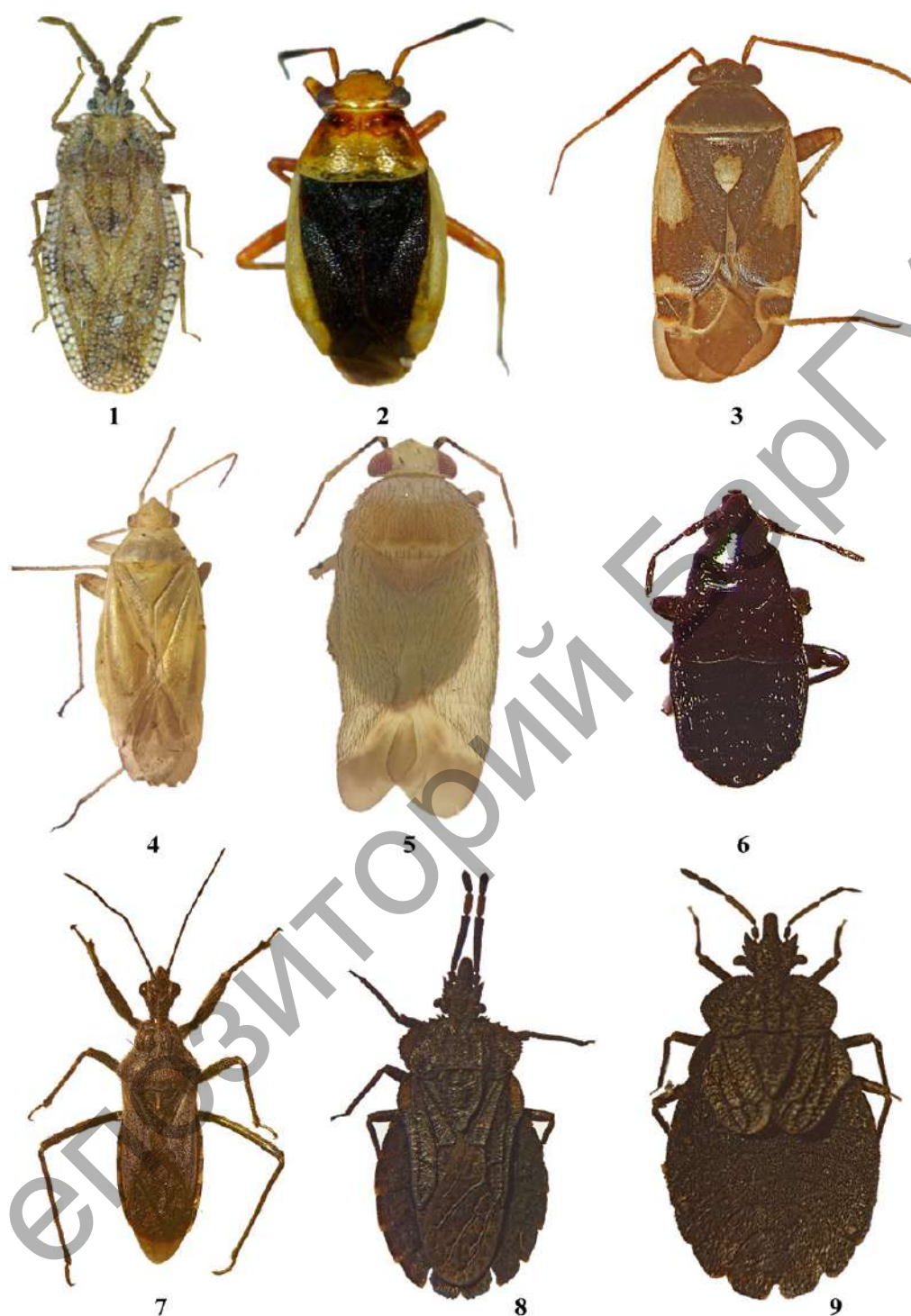
Рисунки 1—9. — Габитусы клопов с дорсальной стороны (I): 1 — Tingis crispata (Herrich-Schaeffer, 1838); 2 — Capsus cinctus (Kolenati, 1845); 3 — Polymerus brevicornis (Reuter, 1879); 4 — Amblytylus concolor Jakovlev, 1877; 5 — Campylomma simillimum Jakovlev, 1882; 6 — Xylocoris thomsoni (Reuter, 1883); 7 — Coranus kerzhneri P. V. Putshkov, 1982; 8 — Aradus annulicornis Fabricius, 1803; 9 — Aradus distinctus Fieber, 1860