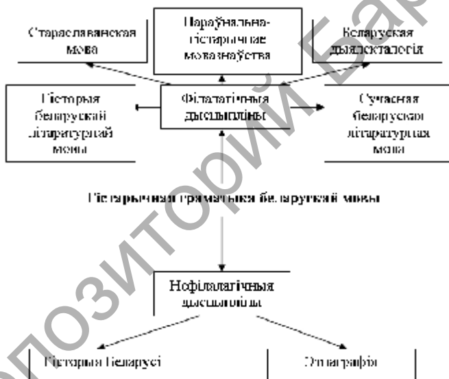
Рысунк 1 — Сувязь гістарычнай граматыкі беларускай мовы з іншымі дысцыплінамі

Каб уявіць сувязь гістарычнай граматыкі з іншымі навуковымі дысцыплінамі, варта разгледзець схему на рысунку 1: