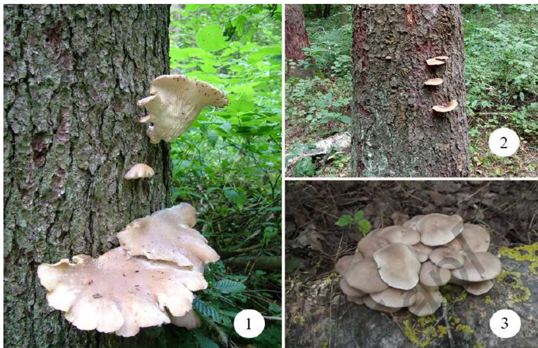
Рисунки 1—3. — Спорокарпы грибов из рода Pleurotus (Fr.) P. Kumm.: 1 — спорулирующие плодовые тела вешенки на стволе ели; 2 — разлагающиеся плодовые тела вешенки на стволе ели; 3 — молодые плодовые тела вешенки на стволе осины