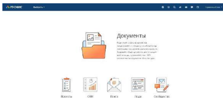
Рисунок 2 — Общее окно облака Р7-Офис

1.2. Облачная версия: также редакторы, но уже в облаке, проекты, CRM, почта, люди, сообщество. Некоторые возможности редакторов работают только в облачной версии. Например, в текстовом редакторе можно выполнить «Слияние» (команда, когда по одному шаблону можно растиражировать документы или письма с уникальными полями) только в облачной версии. Ну и совместная работа, естественно, тоже. В частности, в облачной версии есть возможность включить чат и общаться с коллегами сразу в документе (рисунок 2).