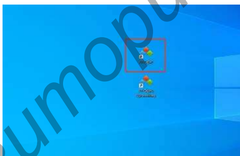
Рисунок 1 — Р7-Офис на Рабочем столе

1.1. Десктопная версия: 3 редактора в комплекте: текстовый, табличный, презентации. Следует заметить, это одно приложение сразу с 3 встроенными редакторами. То есть, при открытии одного окна в нем уже можно работать с текстом, таблицами или презентациями, соответственно, ярлык на рабочем столе тоже один (рисунок 1).