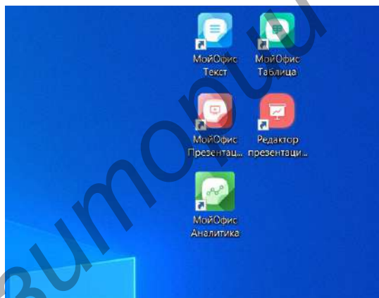
Рисунок 3 — МойОфис на Рабочем столе

Для образования — Текст, Таблица, Презентация (рисунок 3).