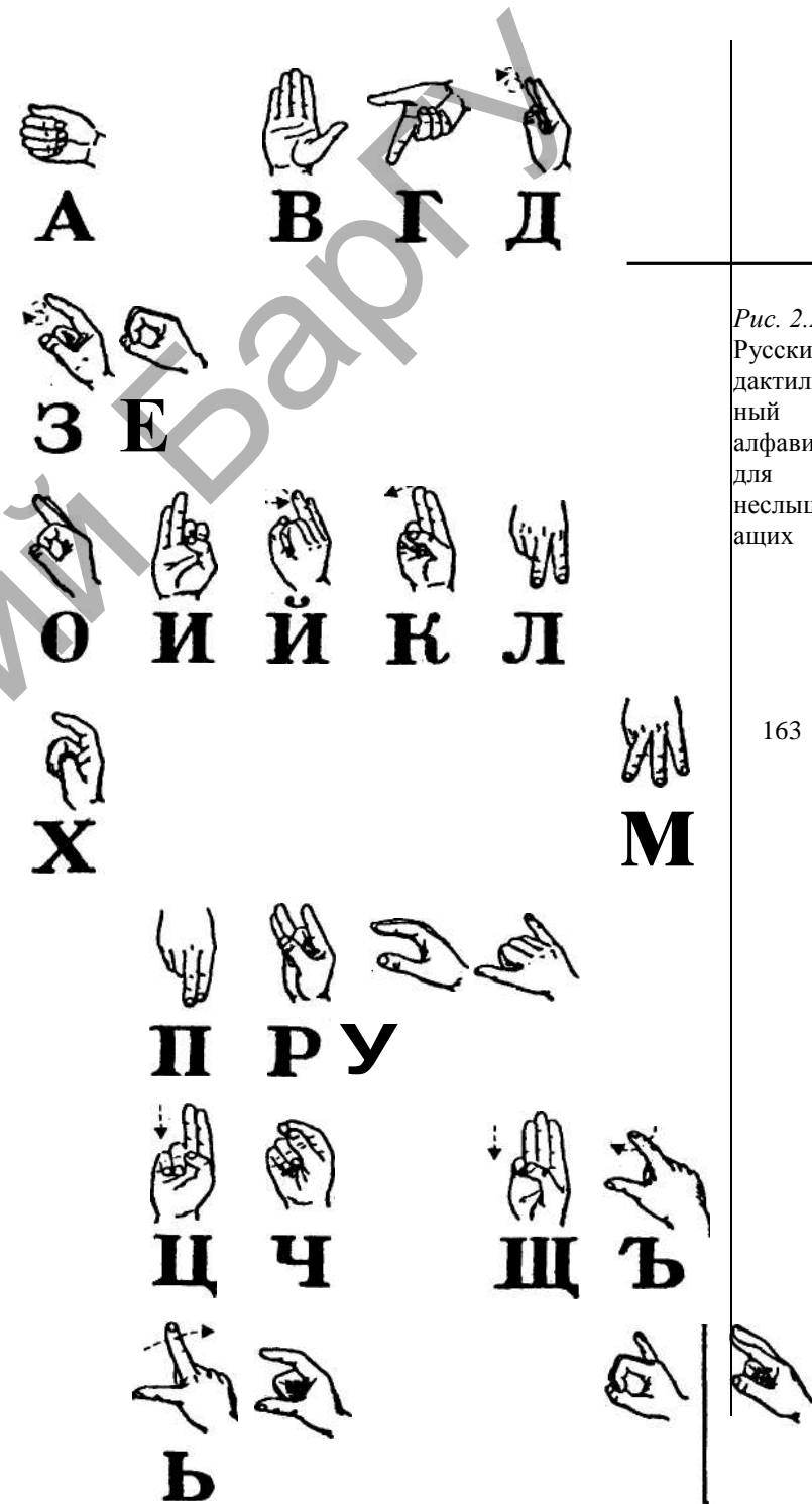
Рис. 2.2. Русский дактильный алфавит для незлыш ащих

Люди, имеющие нарушение слуха, для организации оощепия используют дактильную азбуку и жестовую речь. Дактилология (движения пальцев рук (жесты) обозначают буквы алфавитов национальных языков) и жестовая речь - это особая кинетическая система для компенсации импрессивной и экспрессивной устной речи (рис. 2.2 и 2.3).