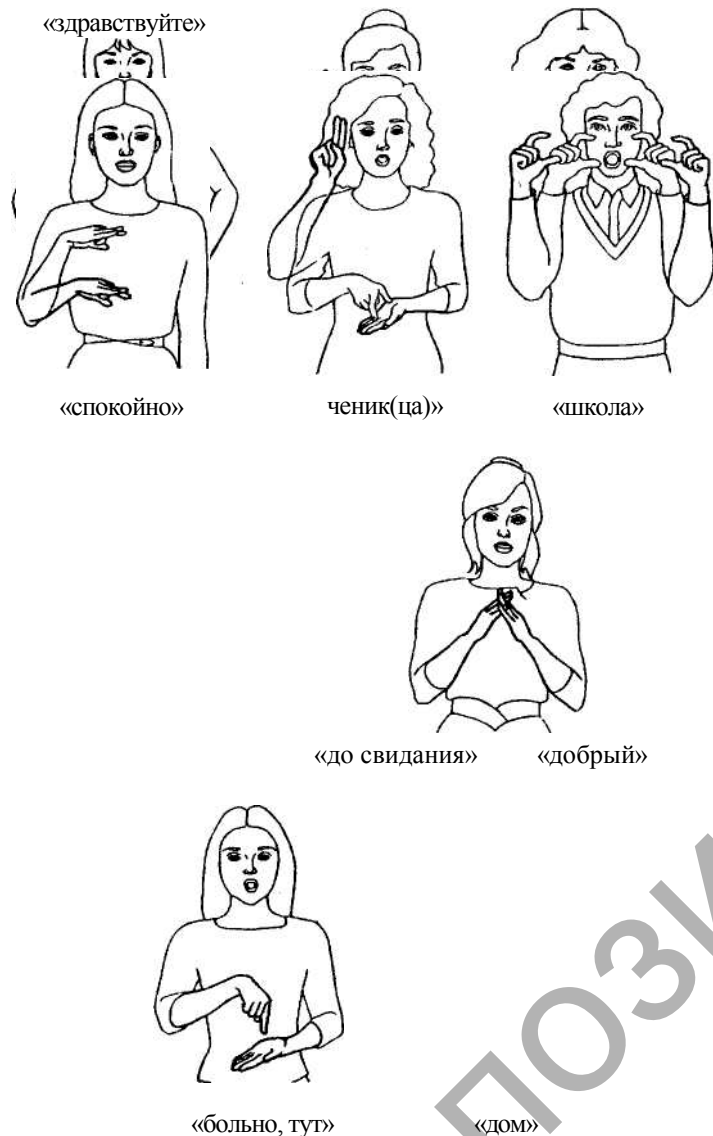
Рис. 2.3. Использование жестов при общении с незлышащими детьми