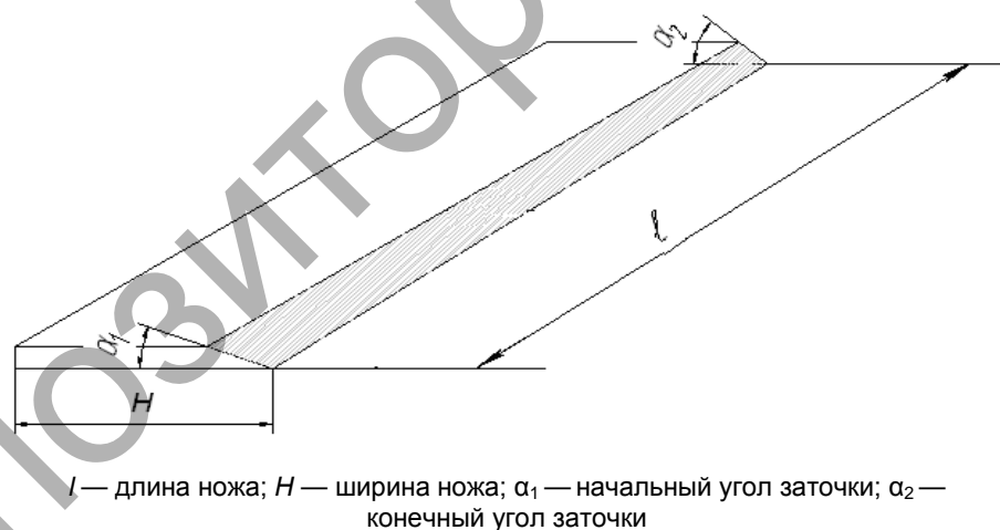
Рисунок 1. — Геликоидальный рубильный нож

На рисунке 2 схематически показан геликоидальный рубильный нож, заточенный при настройке механизма по концевым точкам.