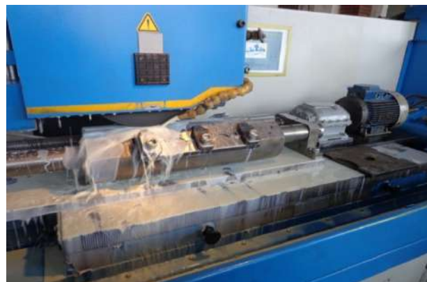
Рисунок 5. — Фотография устройства для заточки геликоидальных рубильных ножей, укомплектованного электродвигателем