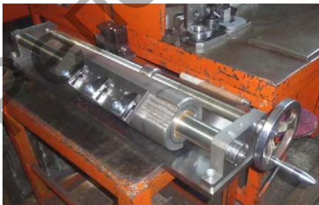
Рисунок 4. — Устройство для заточки геликоидальных рубильных ножей с ручным управлением

Представим фотографию устройства, укомплектованного электродвигателем и редуктором (рисунок 5).