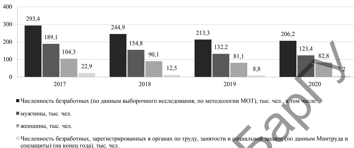
Рисунок 2 — Численность безработных Республики Беларусь в 2017-2020 гг., тыс. чел.

Численность безработных по данным выборочного исследования и состоящих на учете в органах по труду, занятости и социальной защите за 2017—2020 годы отражена на рисунке 2.