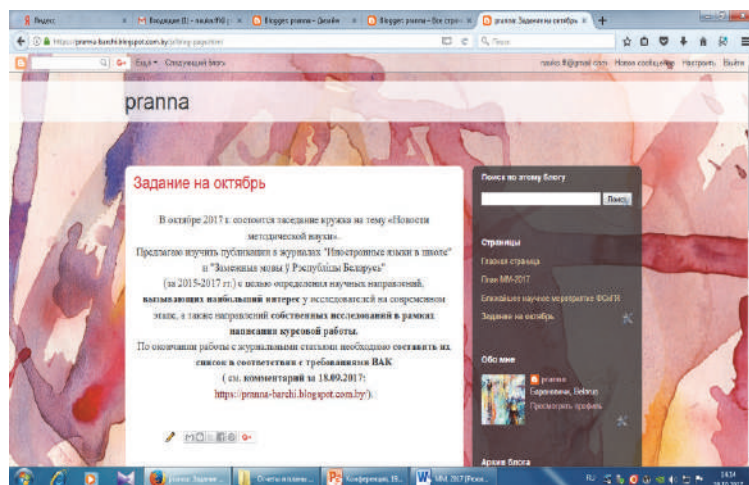
Рисунок 3 — Страница блога «Задание по плану работы кружка»

Заключение. Представленные выше структура и содержание блога “Pranna”, а также функциональные возможности блог-технологии позволяют сделать вывод о ее высоком методическом потенциале как средства оптимизации процесса формирования профессиональной компетенции студентов языковых специальностей в области научно-исследовательской деятельности.