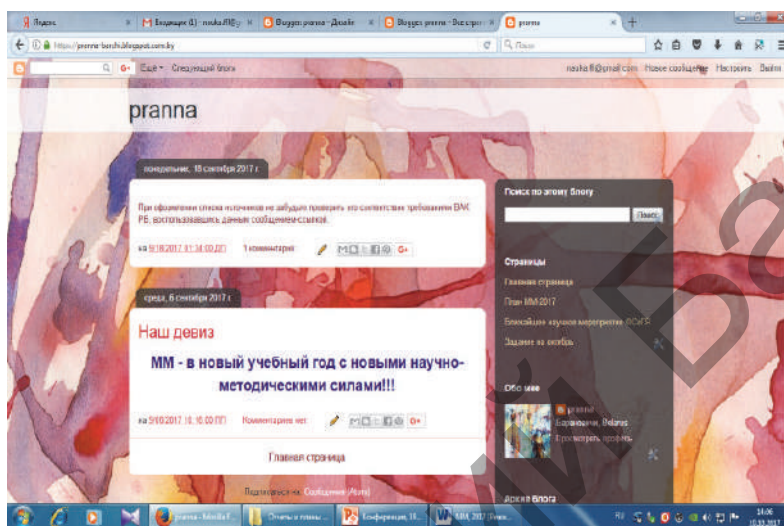
Рисунок 1 — Главная страница блога «Pranna»

1) «Главная» — размещает сообщения блога и комментарии к ним, список страниц, профиль администратора и некоторую статистическую информацию (рисунок 1);