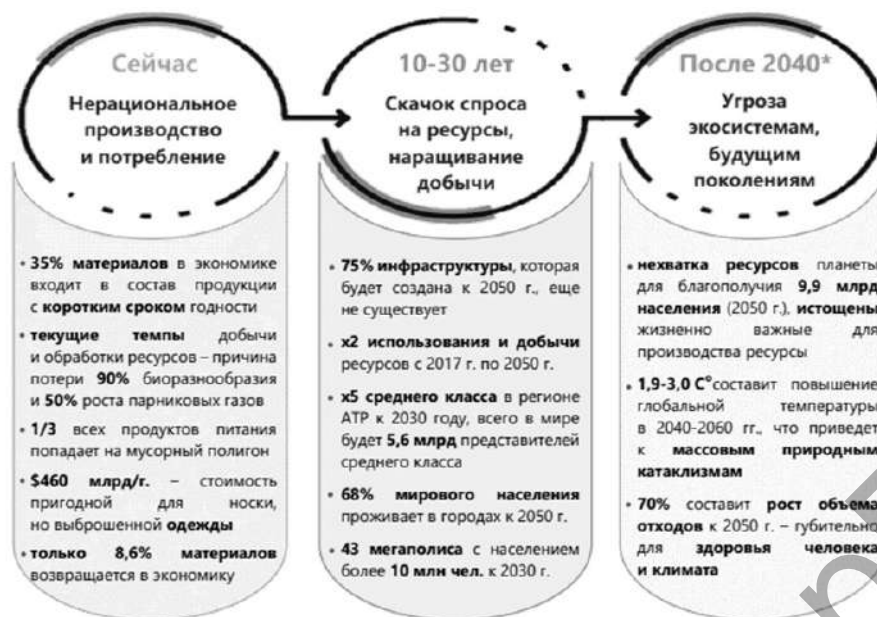
Рисунок 1 — Сценарий при использовании текущей модели производства и потребления

Циркулярная экономика — это экономическая деятельность, направленная на энергосбережение, регенеративное экологически чистое производство, обращение и потребление [2].