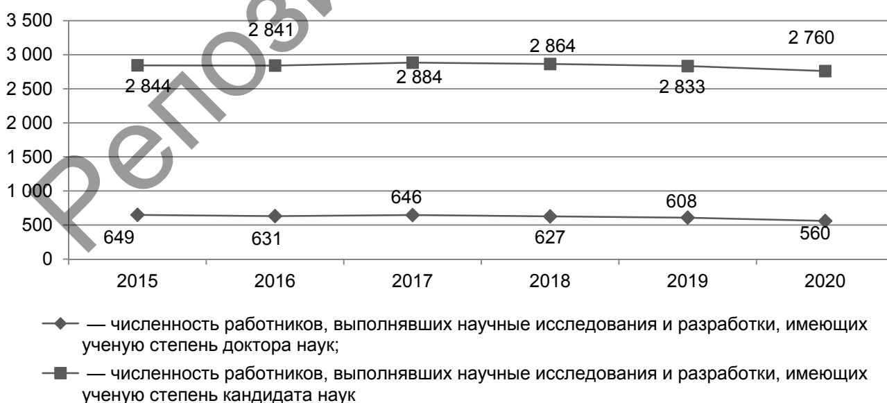
Рисунок 1. — Численность персонала с ученой степенью, занятого научными исследованиями и разработками в Республике Беларусь, в 2015—2020 годах

Численность персонала, занятого исследованиями и разработками, с ученой степенью имеет тенденцию к снижению (рисунок 1).