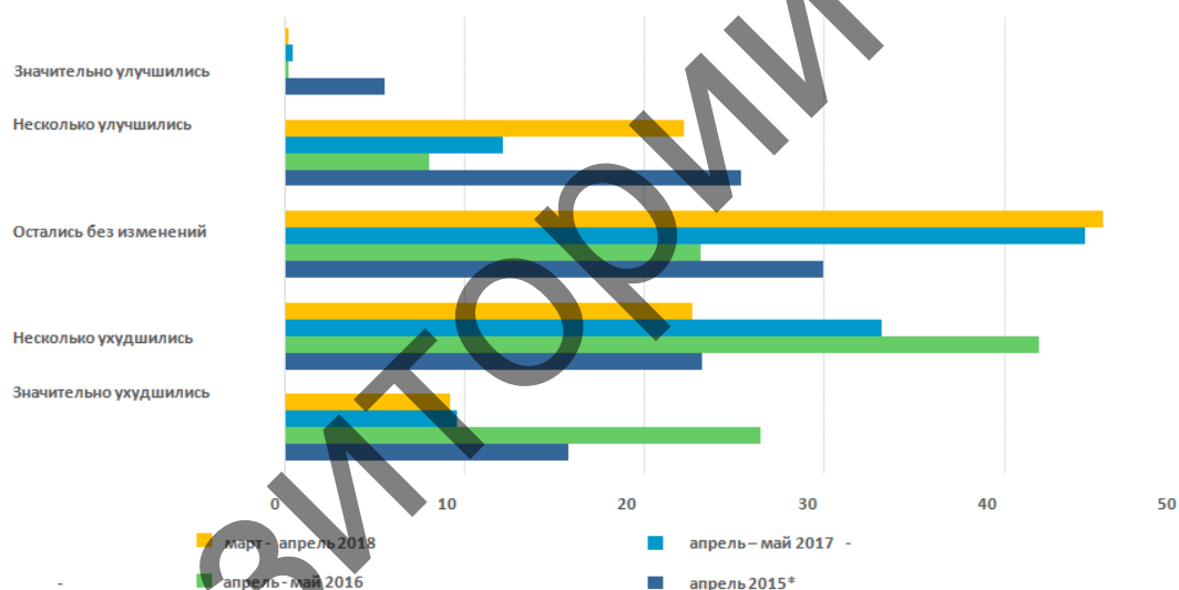
Рисунок 3 — Динамика распределения ответов на вопрос «Как изменились условия ведения предпринимательской деятельности за прошедший год?», % респондентов [4]

Примечание.