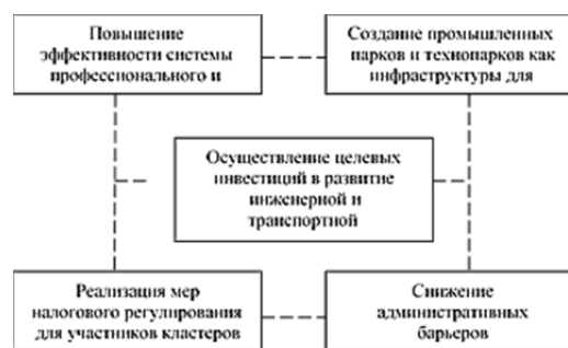
Рисунок 1 — Необходимые условия для развития кластеров в АПК

Основная часть. Кластерная политика в регионах ставит перед системой аграрного образования новые цели, решение которых находится в глубоких преобразованиях системы профессионального образования для подготовки специалистов нового формата. В Методических рекомендациях по реализации кластерной политики в субъектах Российской Федерации первым условием для развития кластеров отмечено повышение эффективности системы профессионального и непрерывного образования (рисунок 1 по [1]). Эти условия актуальны и для развития региональных агропромышленных кластеров, способных менять вектор развития в соответствии с быстро меняющейся ситуацией в стране и мире.