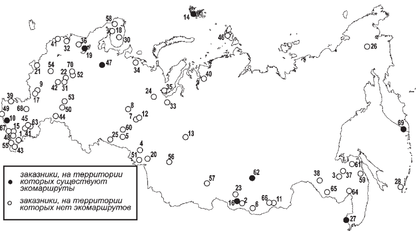
Рис. 3. Государственные природные заказники федерального значения

Цифрами обозначены заказники: 1. Аграханский. 2. Алтачейский. 3. Бад-жалский. 4. Байровский. 5. Белозерский. 6. Буркальский. 7. Васьпухольский. 8. Верхне-Кондинский. 9. Воронежский. 10. Даутский. 11. Долина Дзерена. 12. Елизаровский. 13. Елогуйский. 14. Земля Франца-Иосифа. 15. Ингушский. 16. Кабанский. 17. Каменная Степь. 18. Канозерский. 19. Кижский. 20. Кирзинский. 21. Клетнянский. 22. Клязьминский. 23. Красный Яр. 24. Куноватский. 25. Курганский. 26. Лебединый. 27. Леопардовый. 28. Малые Курилы. 29. Меклетинский. 30. Мурманский тундровый. 31. Муромский. 32. Мшинское. 33. Надымский. 34. Ненецкий. 35. Нижне-Обский. 36. Олонецкий. 37. Олджиканский. 38. Орловский. 39. Приазовский. 40. Пуринский. 41. Ремдовский. 42. Рязанский. 43. Самурский. 44. Саратовский. 45. Сарпинский. 46. Североземельский. 47. Сийский. 48. Советский. 49. Сочинский. 50. Старокулаткинский. 51. Степной. 52. Сумароковский. 53. Сурский. 54. Таруса. 55. Тляратинский. 56. Томский. 57. Тофаларский. 58. Туломский. 59. Тумнинский. 60. Тюменский. 61. Удиль. 62. Фролихинский. 63. Харбинский. 64. Хехцир. 65. Хингано-Архаринский. 66. Цасучейский бор. 67. Цейский. 68. Цимлянский. 69. Южно-Камчатский. 70. Ярославский