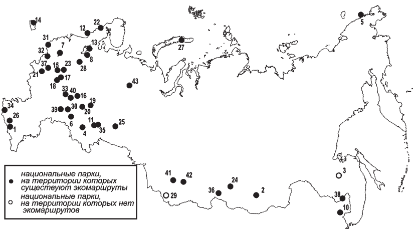
Рис. 1. Государственные природные заповедники Российской Федерации