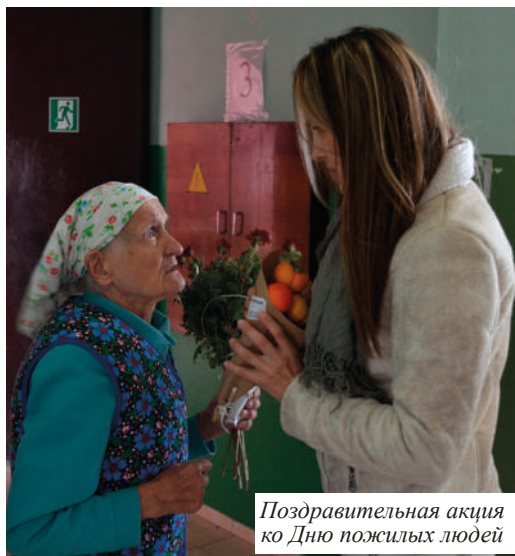
Поздравительная акция ко Дню пожилых людей

Во время посещения людям военного поколения и бывшим узникам безвозмездно были вручены сладости, купленные за счет финсредств гуманитарного проекта для бывших узников и людей военного поколения «Знаки нашей памяти». Финансовая поддержка оказана немецким фондом «Память, ответственность и будущее» совместно с МОО «Взаимопонимание»