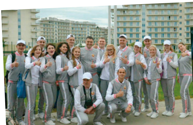
Больше новостей читайте на сайте www.barsu.by и на странице группы «Газета БарГУ on-line» в социальной сети «ВКонтакте».