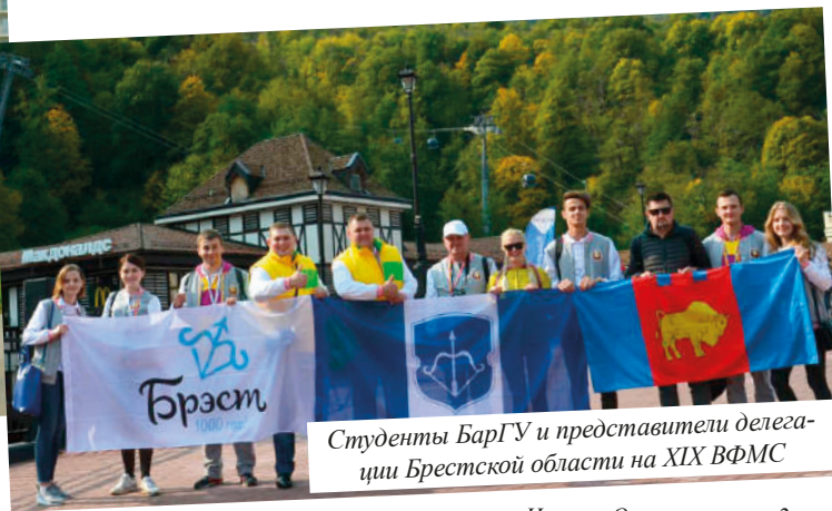
Студенты БарГУ и представители делегации Брестской области на XIX ВФМС