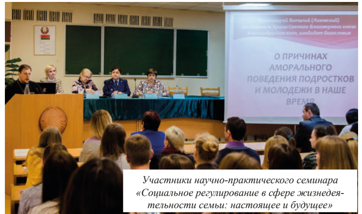
Участники научно-практического семинара «Социальное регулирование в сфере жизнедеятельности семьи: настоящее и будущее»