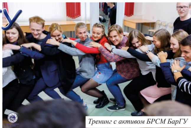
Тренинг с активом БРСМ БарГУ

В мероприятии приняли участие секретари факультетов, групп и активные члены БРСМ. В ходе ивента был организован открытый диалог и тренинг «Управленческие навыки в студенческой