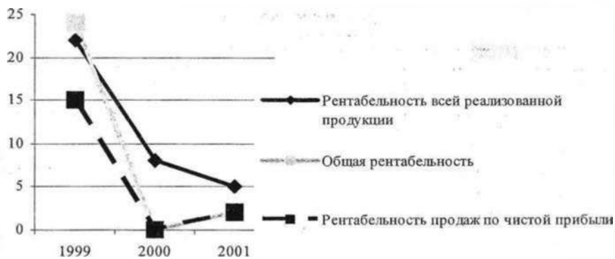
Рисунок 4.1 – Изменение показателей рентабельности продукции за 1999–2001 гг.

Примечание – Источник: собственная разработка.