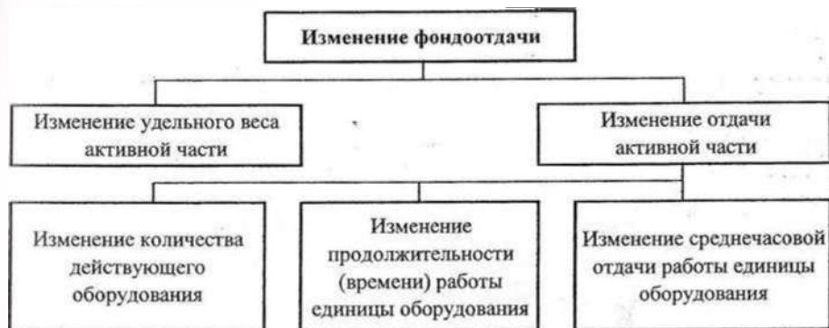
Рисунок 2.1 – Структурно-логическая модель факторной системы фондоотдачи