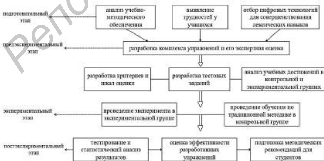
Рисунок 2 — Этапы организации экспериментальной работы по совершенствованию лексических навыков