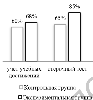
Рисунок 3 — Статистический анализ постэкспериментального тестирования учащихся

Постэкспериментальный этап подразумевает проведение тестирования и статистический анализ полученных результатов; а также оценку эффективности разработанного комплекса упражнений и разработку методических рекомендаций для студентов-практикантов, будущих учителей иностранного языка. После завершения эксперимента был проведен комплексный отсроченный тест в контрольной и экспериментальной группах (рисунок 3).