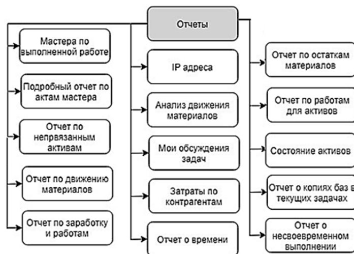
Рисунок 2 — Отчеты

Заключение. Разработанный программный продукт создан в соответствии с требованиями технического задания рассматриваемой базы исследования. Выполнены все поставленные задачи, позволяющие максимально оптимизировать работу сотрудников технического отдела.