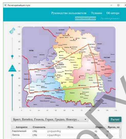
Рисунок 1 — Результат расчёта

Для произведения расчёта кратчайшего пути пользователь отбирает необходимые города, устанавливает процент мутации особей (по умолчанию 10%) и размер популяции (по умолчанию 100000 особей), далее расчёт. Так как в программе существует глобальная матрица, содержащая в себе расстояния между существующими городами, на её основе генерируется новая матрица с выбранными городами, где расстояния берутся из глобальной матрицы. Оператор мутации необходим для «выбывания» популяции из локального экстремума и способствует защите от преждевременной сходимости. Оператор размера популяции особей необходим для получения наиболее точного вычисления кратчайшего пути между городами, но чем больше размер популяции, тем больше время вычисления. Информация о стоимости, пути, количестве итераций и количестве затрачиваемого времени на выполнение расчёта отображается в таблице главного окна программы (рисунок 1).