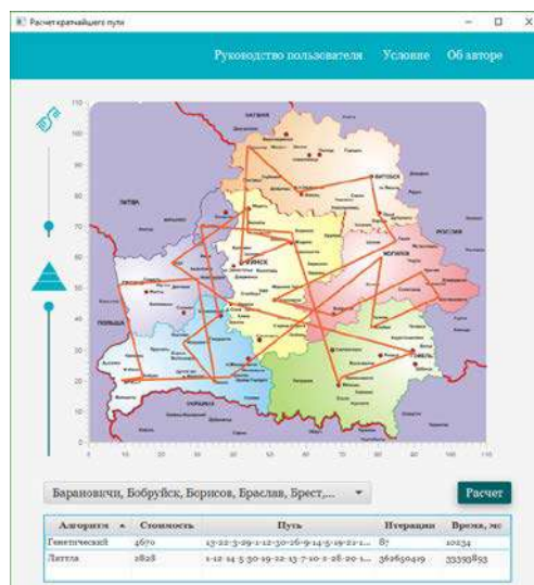
Рисунок 3 — Результат расчёта генетического алгоритма и алгоритма Литтла

В результате проведённых экспериментов, наибольшую эффективность показал алгоритм Литтла. Его недостатком является то, что при увеличении количества городов требуется больше вычислительных ресурсов, в отличие от генетического алгоритма. Если вычислительные мощности ограничены и оптимальность решения не очень критична, то лучше использовать генетический алгоритм. Для получения наиболее точного результата, нужно правильно настроить процент мутации и количество особей.