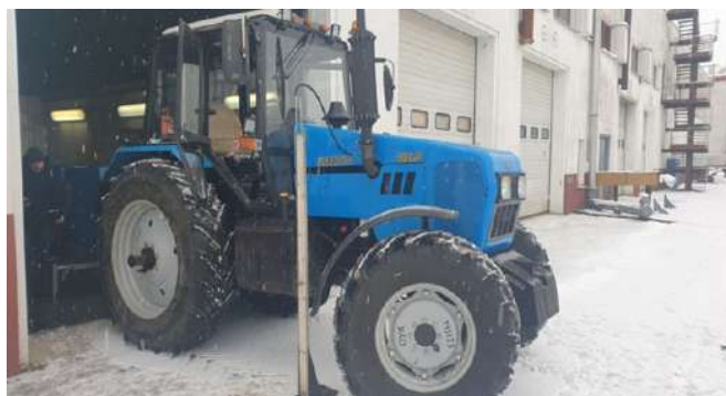
Рисунок 3. Испытания глушителей на тракторе «БЕЛАРУС 1221.3»

Проведены замеры уровней звука и уровней звукового давления в октавных полосах на срезе ГШ в соответствии с программой-методикой 1205ПМ. Замеры произведены в сравнении со штатным ГШ, а также замеры противодавления ГШ. В режиме эксплуатационной мощности двигателя, мощность на ВОМ составляла 94,5 кВт.