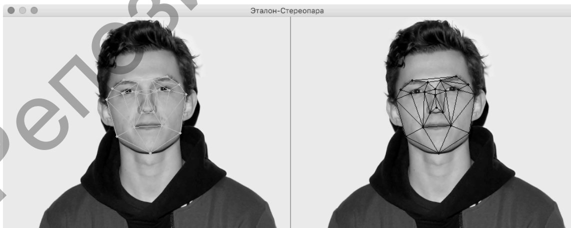
Рисунок 1 — Эталонная стереопара

Для работы режима бинокулярной стереорекострукции кроме эталонного фото необходима эталонная стереопара, загружаемая точно так же. Пример эталонной стереопары и выделенных лицевых ориентиров представлен на рисунке 1.