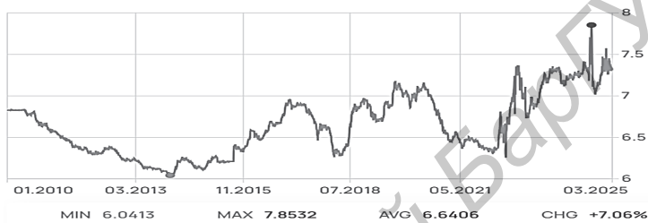
Рисунок 1 — Курс доллара по отношению к юаню

С 2015 года в Китае действует система страхования вкладов, а сумма страхового покрытия составляет 500 тысяч юаней, что составляет 70 000 долларов США. Фонд страхования вкладов в Китае наполняется за счет взносов участников. По итогам 2022 года участниками системы были 4024 банка, а размер страховых премий за год составил 42,38 млрд. юаней.