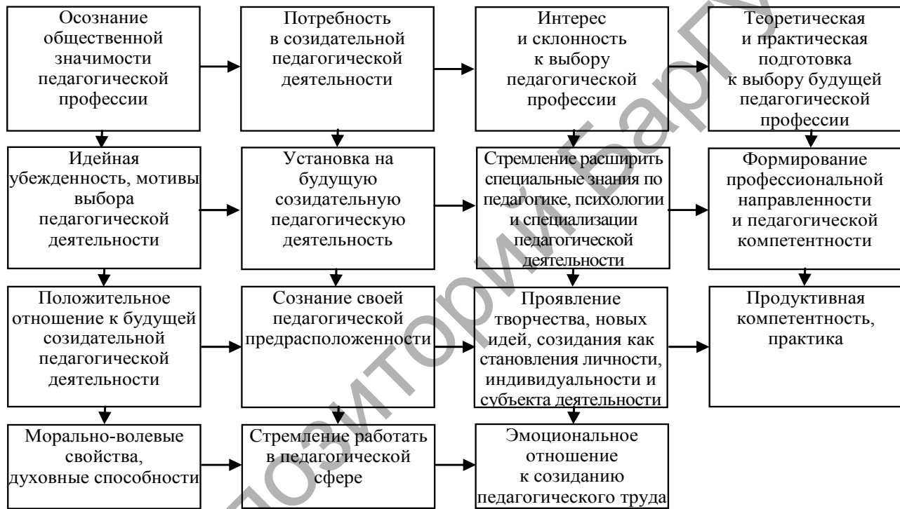
Рисунок 1 — Алгоритм формирования профессиональной направленности субъекта образования на будущую педагогическую деятельность