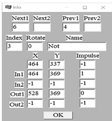
Рисунок 4 — Информация объекта

Очистка поля редактирования производится с помощью кнопки “Clear” или нажать на вкладку «Файл» в меню и выбрать «Очистить».