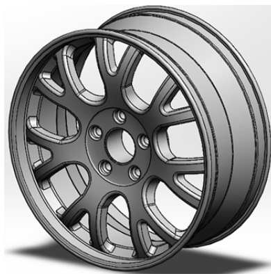
Рисунок 1 — Модель автомобильного диска

Для проведения оптимизации формы модели необходимо сначала произвести расчет статического и частотного анализа. В статическом анализе модель сначала закреплялась, а затем прикладывалось давление 1,5 атмосферы, или же 150000 Паскаль. Также прикладывалась сила равная 4900 Ньютонов, или же 500 килограмм. Результат статического анализа показан на рисунке 2. Результат частотного анализа показан на рисунке 3.