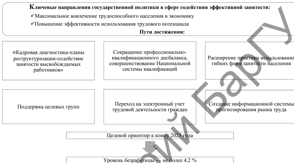
Рисунок 2 — Приоритеты реализации политики занятости и сохранения уровня безработицы в трудоспособном возрасте в 2021–2025 гг.

Целевой ориентир реализации политики занятости к концу 2025 года – сохранение уровня безработицы в трудоспособном возрасте — не более 4,2 процента.