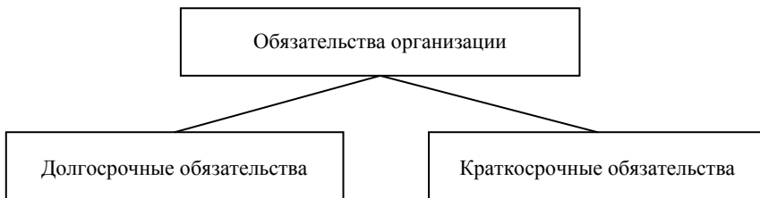
Рисунок 1.1 — Классификация обязательств организации

Примечание — Источник: собственная разработка на основе [25, с. 37].