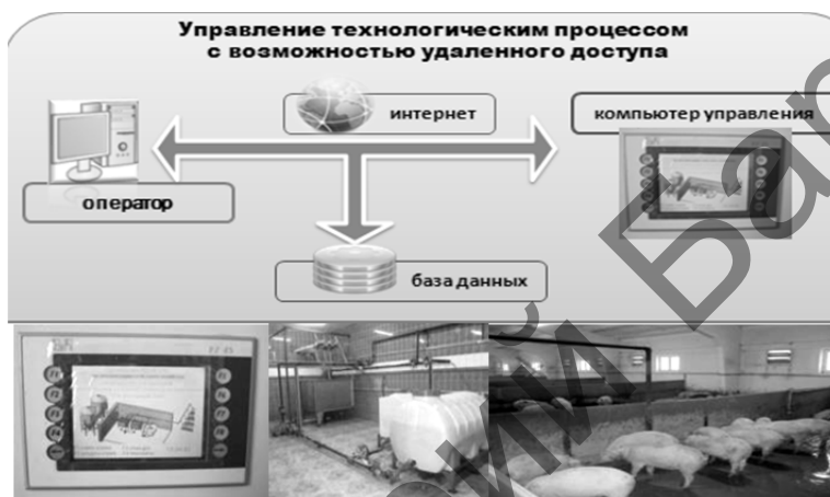
Рисунок 4 — Комплект оборудования для жидкого кормления КОЖК