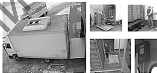
Рисунок 10 — Автофургон для перевозки суточных цыплят АПЦ на базе шасси МАЗ-4371

На заводе «МАЗ-КУПАВА» холдинга «Белавтомаз» по запросам крупных птицефабрик, опираясь на опыт разработки автофургона на шасси МАЗ-4371 (рисунок 11), разработан автофургон повышенной вместимости до 78 тыс. суточных цыплят на базе шасси автомобиля МАН TGS 26.320 с задней пневмоподвеской, изотермическим кузовом, гидробортом и климат-системой TermoKing и Webasto, с автономным дизель-генератором фирмы Yanmar работающим при температуре наружного воздуха от -40 до +40 градусов Цельсия и дальности перевозки до 3000 км (см. рисунок 2). Для крупнейшей птицефабрики изготовлено 2 автофургона.