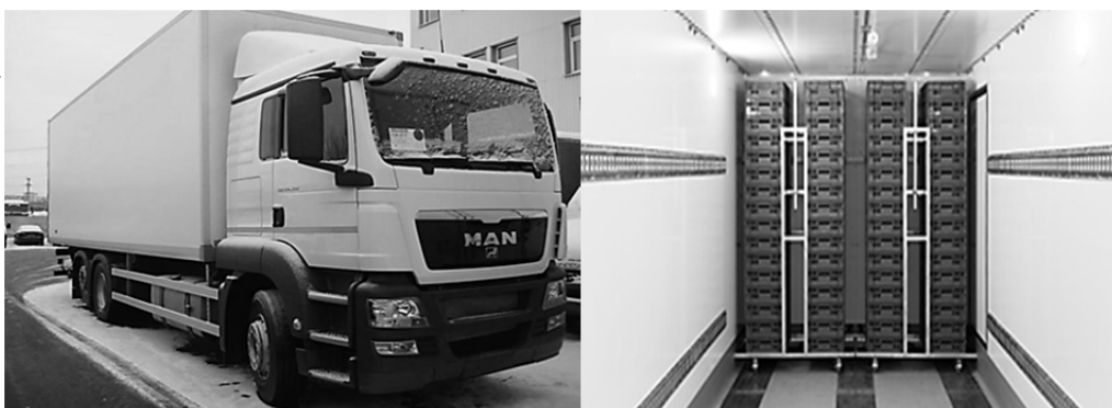
Рисунок 11 — Автофургон для перевозки суточных цыплят на базе шасси МАН-TGS 26.320