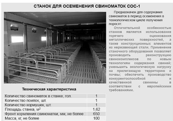
Рисунок 2 — Станок для осеменения свиноматок СОС-1