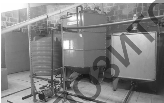
Рисунок 5 — Комплект оборудования микроклимата кормления свиней КОМК