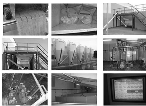
Рисунок 6 — Комплект оборудования для приготовления кормовой добавки на основе консервированного влажного зерна кукурузы КОДК