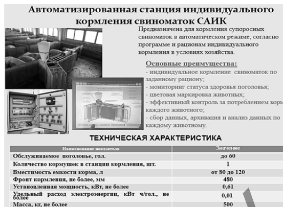
Рисунок 3 — Автоматизированная станция индивидуального кормления свиноматок САИК