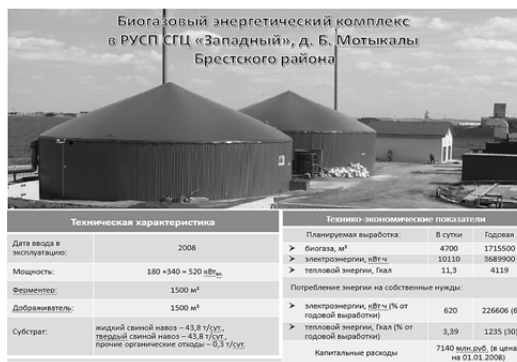
Рисунок 8 — Биогазовый энергетический комплекс мощностью 500 кВт