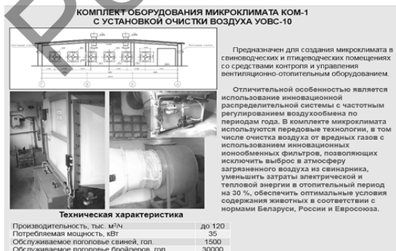
Рисунок 7 — Комплект оборудования микроклимата КОМ-1 с установкой очистки воздуха УОВС-10