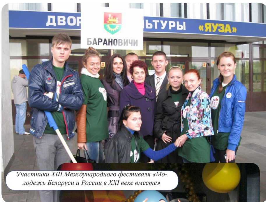
Участники XIII Международного фестиваля «Молодежь Беларуси и России в XXI веке вместе»