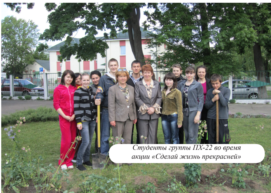
Студенты группы ПХ-22 во время акции «Сделай жизнь прекрасней»