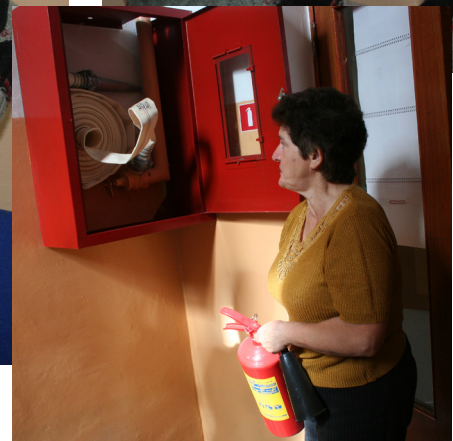
Тактико-специальные учения по ликвидации пожара в административном здании по ул. Войкова, 21.