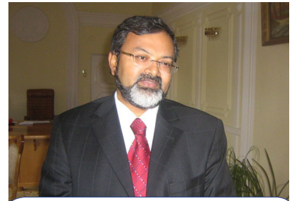
Чрезвычайный и Полномочный Посол Республики Индия в Республике Беларусь Манодж Кумар Бхарти