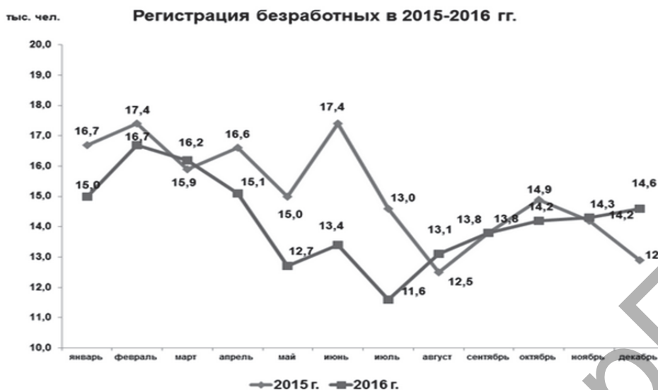
Рисунок 2 — Регистрация безработных в 2015—2016 годах [7]

Спрос на рабочую силу по сравнению с аналогичным периодом прошлого года повысился. На конец 2016 года в органы по труду, занятости и социальной защите поступили сведения о наличии 36 тыс. вакансий, что составило 125,6% к аналогичному периоду 2015 года. Потребность в работниках по рабочим профессиям составила 48,5% от общего числа вакансий против 50,9% на конец 2015 года [6].