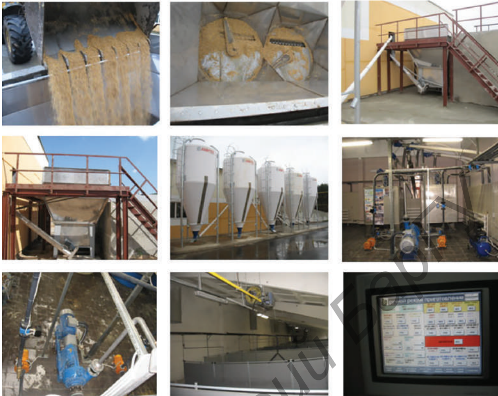
Рис. 3. Комплект оборудования для приготовления кормовой добавки на основе консервированного влажного зерна кукурузы КОДК

повысить продуктивность животных на 7–10 % и снизить удельные расходы на корма на 10–15 %.