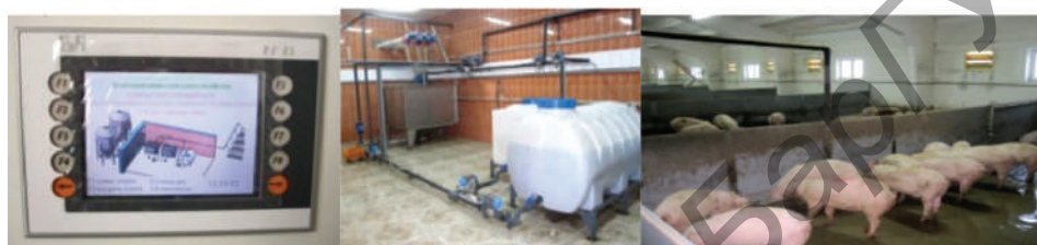
Рис. 2. Комплект оборудования для жидкого кормления КОЖК

Исследования процессов приготовления кормовой добавки на основе консервированного влажного зерна кукурузы в рамках выполнения программы союзного государства «Комбикорм» в 2012 г. позволили проанализировать и выбрать приемлемые варианты приготовления, сформировать технологический регламент с рецептами использования кормовой добавки из влажного плющеного зерна кукурузы в рационе кормления свиней. Создан отечественный комплект оборудования нового поколения, обеспечивающий полную механизацию и автоматизацию процесса приготовления кормовой добавки на основе консервированного влажного зерна кукурузы КОДК (рисунок 3). Ключевым процессом в приготовлении кормовой добавки является диспергирование влажного зерна кукурузы.