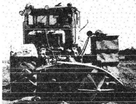
Рисунок 2 – Смеситель-разравниватель для внесения консервантов СКР-5

Применение смесителя-разравнивателя обеспечивает заготовку качественного силоса из бобовых и злаковых культур.