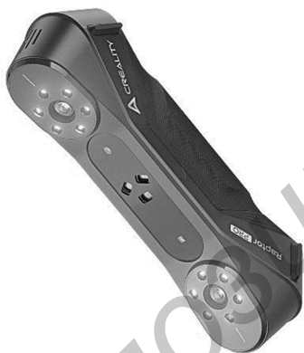
Рисунок 1 — Сканер Creality CR-Scan Raptor

Наконец, реперные точки также могут быть установлены на основании вспомогательных конструкций. Это обеспечивает стабильную привязку к базовой плоскости и минимизирует ошибки позиционирования. Установка реперных точек на основании помогает гарантировать, что данные будут правильно интерпретированы и обработаны, что в свою очередь повышает общую точность 3D модели.