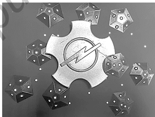
Рисунок 2 — Расположение реперных точек и плоскости

Заключение. Реперные точки — ключевой элемент для повышения точности и удобства работы с 3D-сканированием, особенно при создании сложных моделей из множества отдельных сканов. Правильное расположение реперных точек на вспомогательных башнях и пирамидках является ключевым фактором для успешного 3D-сканирования. Это не только улучшает качество получаемых данных, но и упрощает процесс обработки информации после сканирования. Использование таких конструкций позволяет значительно повысить эффективность работы с большими объектами или сложными сценами, обеспечивая при этом высокую степень детализации и точности моделей.