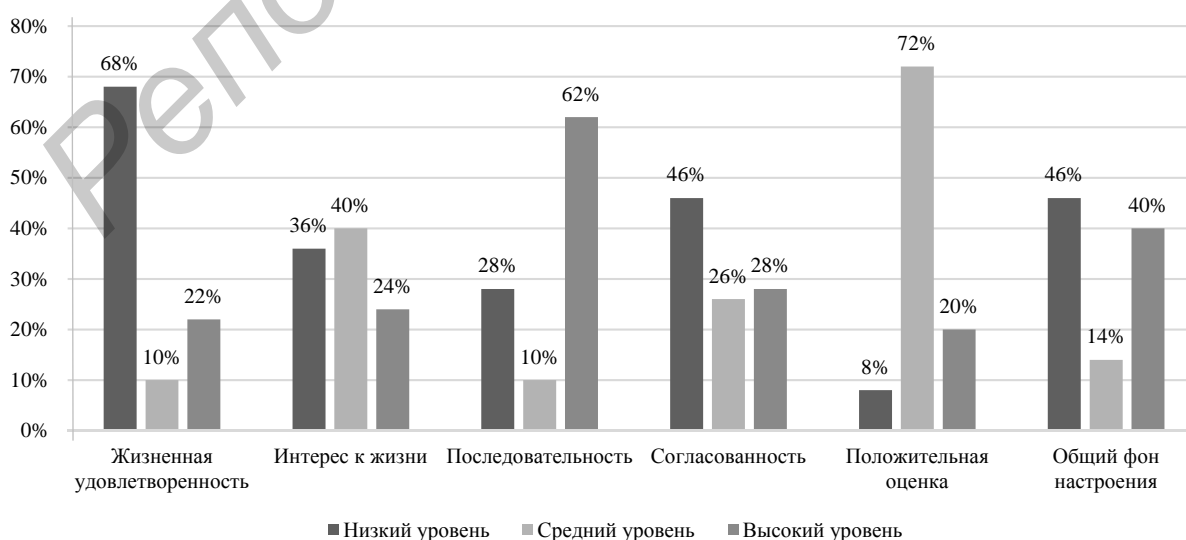
Рисунок 1 — Результаты изучения уровня жизненной удовлетворённости у юношей

Результаты исследования жизненной удовлетворённости среди юношей выявили сложную динамику. Наиболее тревожным оказался показатель общего индекса: 68 % респондентов продемонстрировали низкий уровень удовлетворённости, что свидетельствует о массовом психологическом дискомфорте. Лишь 22 % участников показали высокие результаты, указывая на выраженную поляризацию в группе.