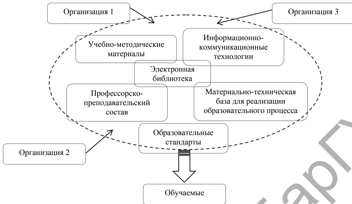
Рисунок 1 — Схема сетевого взаимодействия

(тему, вопрос), просмотреть (прослушать) видеоматериал (аудиоматериал), пройти викторину по вопросам рассматриваемой темы, пройти тест на проверку полученных знаний, выполнить типовое решение заданий, оставить (задать) вопрос преподавателю [3; 4].