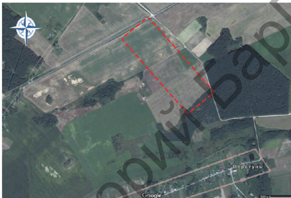
Рысунак 1 — Карта месцазнаходжання каменнай свідраванай сякеры

Уводзіны. У 2013 годзе каля в. Перстунь Падлабенскага сельскага савета Гродзенскага раёна (рысунак 1) была знойдзена каменная свідраваная сякера (далей — КСС). Праз два гады (2015) В. Пуцілоўскі перадаў артэфакт на захаванне у музей «Хрысціянскія каштоўнасці і народныя традыцыі у сям'і», які размяшчаецца на базе ДУА «Сярэдняй школы № 38 г. Гродна».