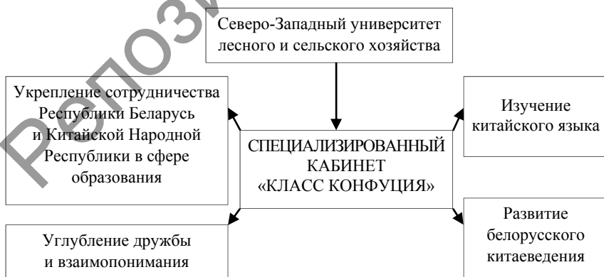
Рисунок 2 — Направления сотрудничества Барановичского государственного университета и Северо-Западного университета лесного и сельского хозяйства